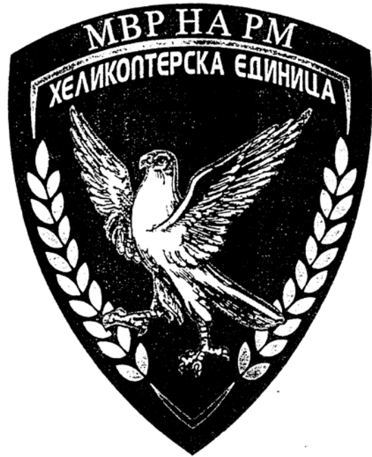
Прилог бр. 18