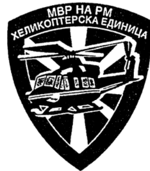
Прилог бр. 20