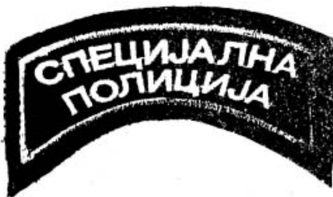
ПРИЛОГ БРОЈ 5