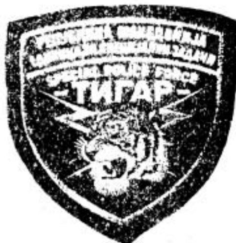
ПРИЛОГ БРОЈ 6