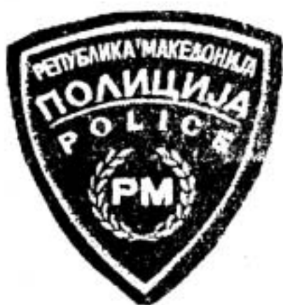
ПРИЛОГ БРОЈ 3